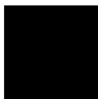
Lýdia Šuchová riaditeľka Agentúry na podporu výskumu a vývoja